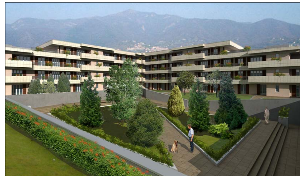
VISTA TRIDIMENSIONALE INTERNA