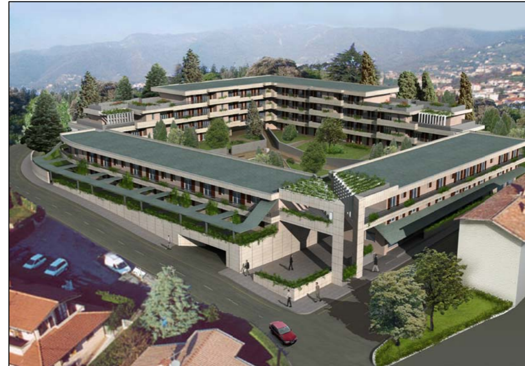
VISTA TRIDIMENSIONALE ESTERNA