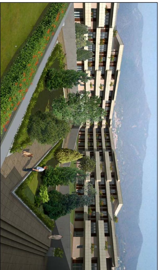
VISTA TRIDIMENSIONALE INTERNA