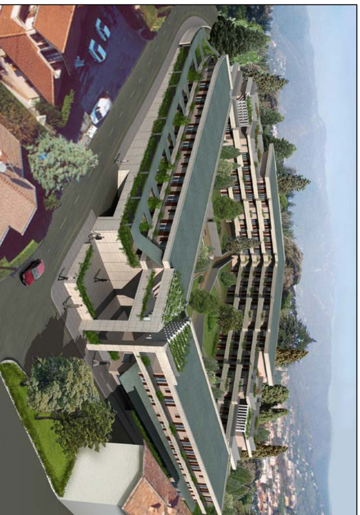
VISTA TRIDIMENSIONALE ESTERNA